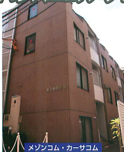
メゾンコム・カーサコム